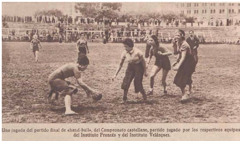
[Ilustración 4: “Campeonato Universitario Femenino de hand-ball”, Crónica , 19/05/1935, p. 12]

El éxito del campeonato universitario y la excelente organización del deporte escolar madrileño llevó a la organización del primer “Campeonato de Castilla de Hand-ball” (Fernández, 1936). Hacia mayo de 1935 ya se había constituido la Federación Castellana de Hand-ball, principalmente destinada a la organización de los campeonatos femeninos, pero también decidida a iniciar la expansión hacia la población masculina, empezando por la escolar. Inmediatamente después de finalizar el Campeonato Universitario, en junio de 1935, se organizó en el campo de “El Parral” un campeonato femenino de Castilla con la presencia de nuevos equipos como el Madrid FC, el Español, el Nacional, las Legionarias de la Salud y la Sociedad Gimnástica Española. Esta competición fue ganada por el equipo Nacional ( La Libertad , 27 y 28/06/1935, p. 10).