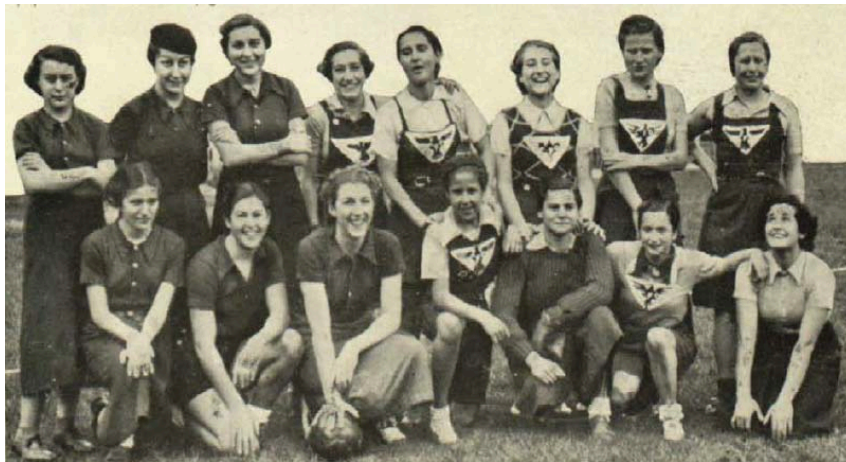
[Ilustración 5: Los equipos femeninos de Hand-ball del Club Femenino de Deportes y de la F. U. E. Deportiva que celebraron un interesante partido el domingo 22 de marzo de 1936. Aviación y deportes , núm. 3 p. 33]