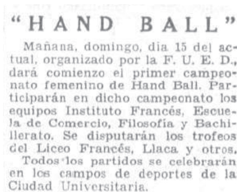
[Ilustración 2: Noticia en El Sol , 11 de abril de 1934, p. 8]

En la prensa se comentaba que la FUE había encontrado la práctica deportiva que mejor podía encajar en la afición femenina. Al respecto se citaba que el hand-ball –‘handbol’ o ‘jambol’ –como también se proponía llamar al juego– “tiene una especial marca de agilidad y de gracia, que no es posible encontrar a otros juegos” (M. P., 1935, p. 9). Efectivamente, el Campeonato Universitario de 1935 había alcanzado cotas de popularidad y se había establecido como el primer deporte universitario femenino (Cruz, 1935). El triunfo de este segundo campeonato fue para el Instituto-Escuela, centro docente que seguía la línea doctrinal de la Institución Libre de Enseñanza (Palacios, 1988).