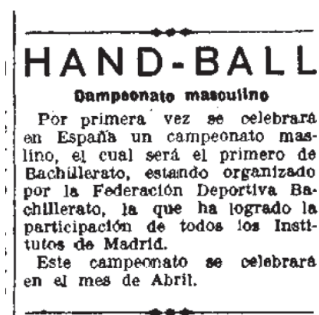
[Ilustración 7: Noticia de Hand-ball en La Libertad , 21/03/1936, p. 8]