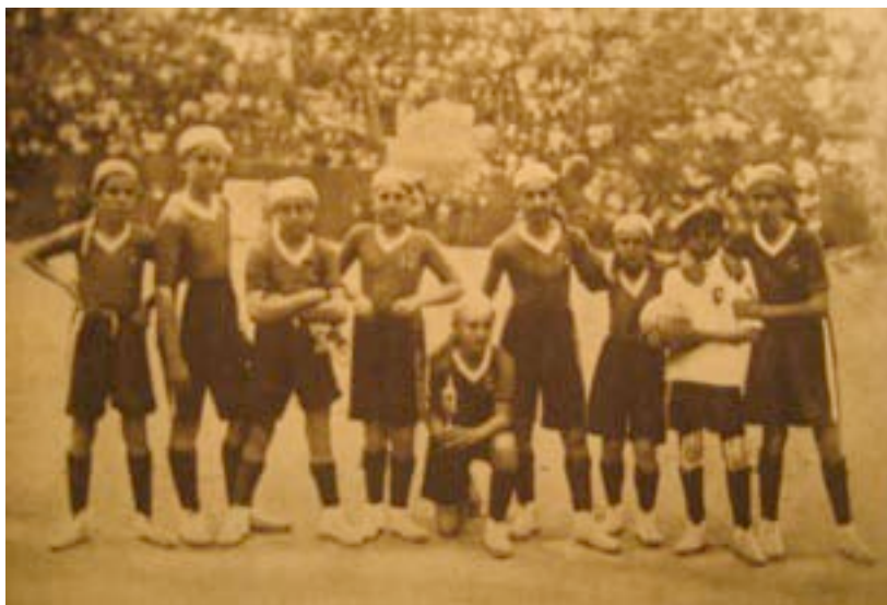
[Ilustración 1: Equipo infantil de Melilla ganador de Campeonato de hand-ball . La Vanguardia-Notas Gráficas , 02/05/1930, p. 3. Foto: Zarco y López]

Los Exploradores de España organizaron desde su fundación numerosos concursos y festivales gimnástico-deportivos. Entre sus deportes favoritos estaban el boxeo y el fútbol, aunque también se pusieron en práctica numerosos juegos del tratado del capitán Baden Powell (1914), entre los que se encontraban algunos con balón. Por eso no debería parecer excepcional que dicha asociación también se iniciara, desde principios de los años veinte al juego de “Balón a la mano” de Jentzer, aspecto que podría relacionarse con la introducción del juego en algunos de sus conocidos campeonatos deportivos. Como prueba aportamos la noticia que en 1930 el equipo de Exploradores de Melilla conquistó en hand-ball la Copa de oro de los Exploradores de España. Esta noticia fue presentada en La Vanguardia Notas Gráficas con la incorporación de la foto del equipo vencedor del campeonato (2/05/1930, p. 3).